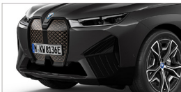
iX xDrive50 旗艦版