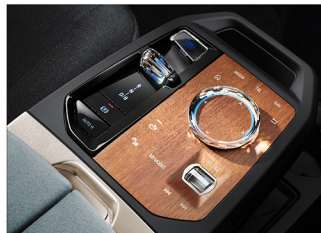
天然木紋飾板 iX xDrive40 旗艦版 / iX xDrive50 旗艦版 / iX M60