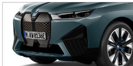
iX xDrive40 旗艦版