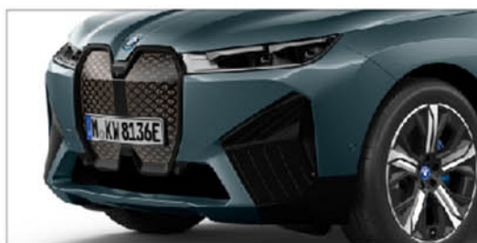
iX xDrive40 旗艦版