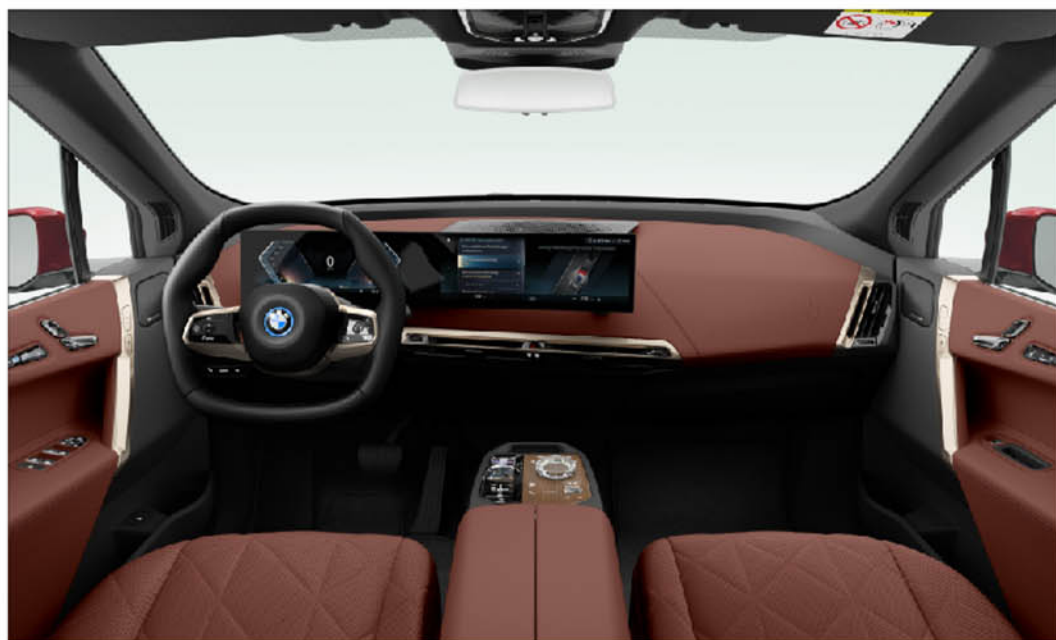
橄欖葉鞣製天然真皮 / 一體式座椅 iX xDrive40 旗艦版 / iX xDrive50 旗艦版 / iX M60