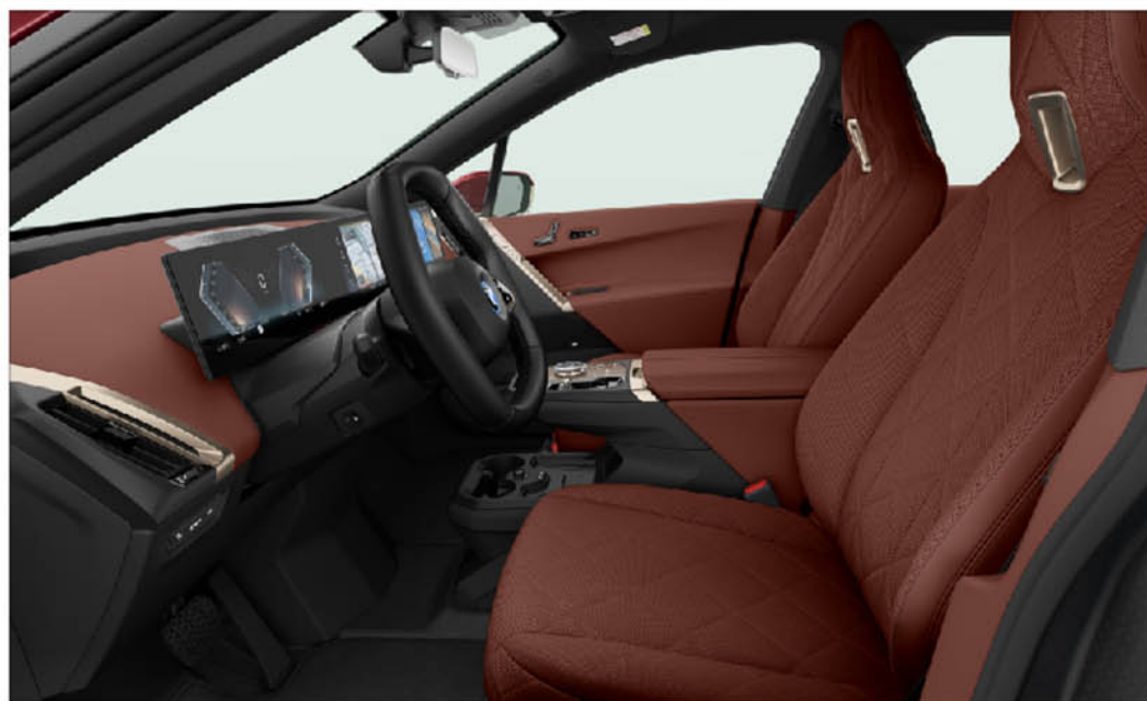
橄欖葉鞣製天然真皮 / 一體式座椅 iX xDrive40 旗艦版 / iX xDrive50 旗艦版 / iX M60