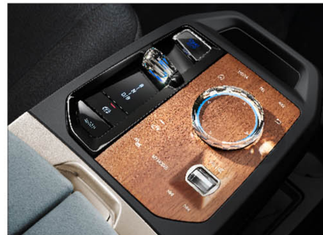
天然木紋飾板 iX xDrive40 旗艦版 / iX xDrive50 旗艦版 / iX M60