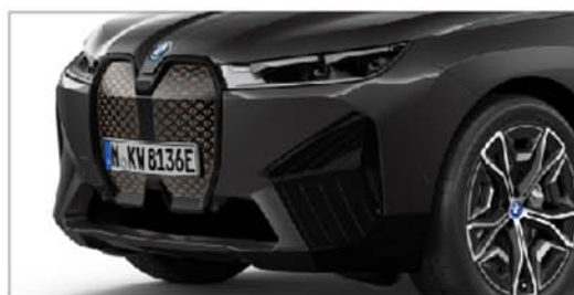
iX xDrive50 旗艦版