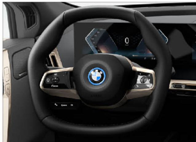
六角造型多功能真皮方向盤 iX xDrive40 旗艦版 / iX xDrive50 旗艦版 / iX M60