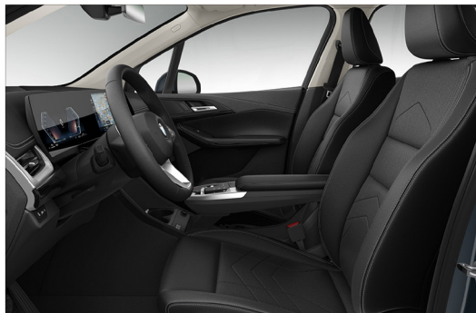
Veganza 透氣皮質 / 標準座椅 220i Active Tourer