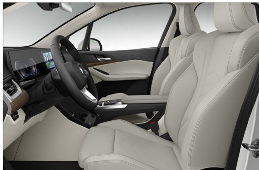
Veganza 透氣皮質 / 跑車座椅 220i Active Tourer Luxury