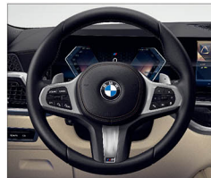
M多功能真皮方向盤 (含換檔撥片)