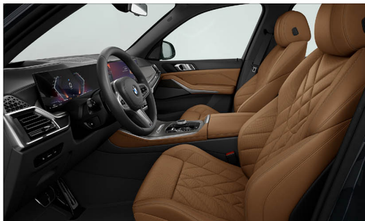
Sensafin 透氣皮質 / 跑車座椅 X5 xDrive40i M Sport