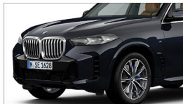
X5 xDrive40i M Sport