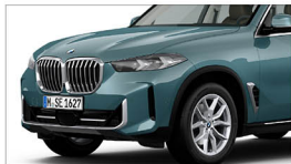
X5 xDrive30d xLine