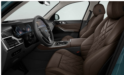
Sensafin 透氣皮質 / 跑車座椅 X5 xDrive30d xLine