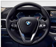
跑車多功能真皮方向盤 (含換檔撥片)