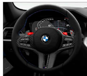
M專屬多功能真皮方向盤 (含換檔撥片)