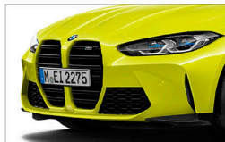
M4 Competition / M4 Competition Racing Package