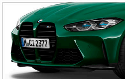
M3 Competition / M3 Competition Racing Package