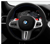
M專屬多功能真皮方向盤 (含換檔撥片)