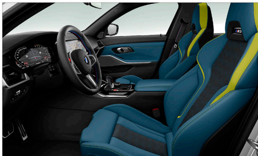
Merino 真皮 / M 專屬跑車座椅 M3 Competition / M4 Competition