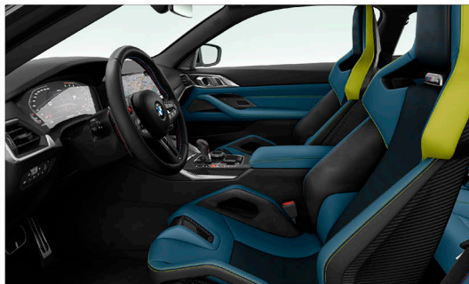
Merino 真皮 / M 專屬碳纖維賽車桶型座椅 M3 Competition Racing Package / M4 Competition Racing Package