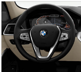
跑車多功能真皮方向盤 318i Luxury