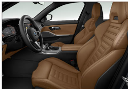
Vernasco 真皮 / M跑車座椅 330i M Sport Midnight 夜型版