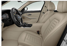
Vernasco 真皮 / 標準座椅 318i Luxury