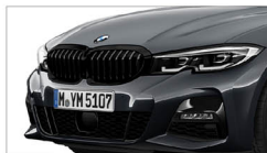
330i M Sport Midnight 夜型版