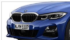
320i M Sport / 330i M Sport