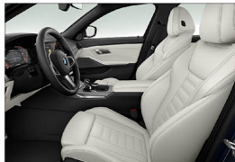
Vernasco 真皮 / 跑車座椅 M340i xDrive