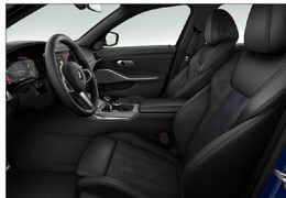
Alcantara 麂皮 / Sensatec 皮質 / 跑車座椅 320i M Sport / 330i M Sport