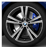
BMW Individual 雙輻式 793i