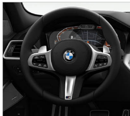
M款多功能真皮方向盤 (含換檔撥片) 320i M Sport / 330i M Sport / 330i M Sport Midnight 夜型版 / M340i xDrive