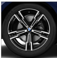
M 雙輻式 848M