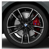
M 雙輻式 792M