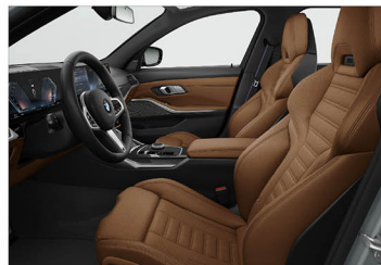
Vernasca 真皮 / M 跑車座椅 M340i xDrive