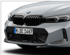
黑色高光澤外觀套件 / 燻黑造型頭燈

330i M Sport 提供優惠 12 萬升級 Racing Package，原選配價：20.6 萬