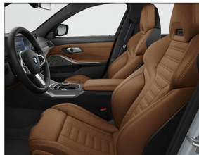
Vernasca 真皮內裝 / M 雙前座跑車座椅

輪圈：8J X 19 / 8.5J X 19 輪胎：225 / 40 R19 255 / 35 R19