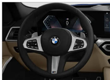
M 多功能真皮方向盤 (含換檔撥片) 320i M Sport