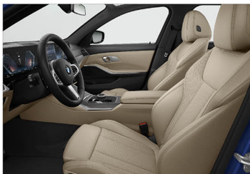
Sensatec 透氣皮質 320i M Sport