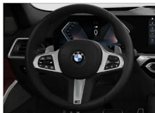
M 多功能真皮方向盤 (含換檔撥片) 330i M Sport