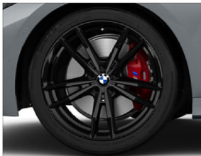
M 雙輻式 791M / M 煞車套件 (紅色)

輪圈：8J X 19 / 8.5J X 19 輪胎：225 / 40 R19 255 / 35 R19