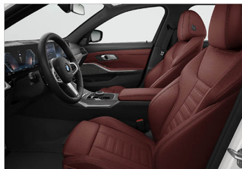
Vernasca 真皮 / 跑車座椅 330i M Sport