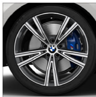
BMW Individual 雙輻式 793i