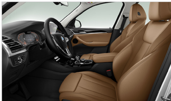
Sensatec 透氣皮質 / 跑車座椅 X3 xDrive20i 運動版