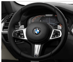
M多功能真皮方向盤 (含換檔撥片) X3 xDrive30i M Sport