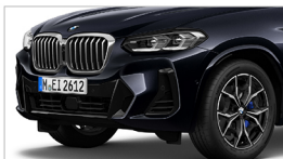
X3 xDrive30i M Sport