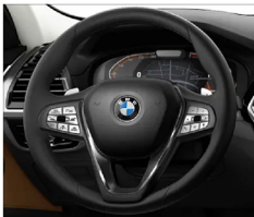
跑車多功能真皮方向盤(含換檔撥片) X3 xDrive20i 運動版