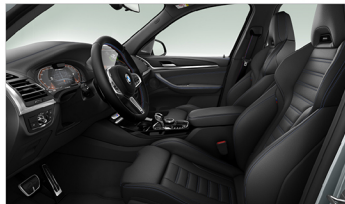
Vernasca 真皮 / M跑車座椅 X3 M40i