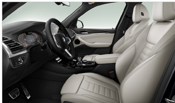
Vernasca 真皮 / 跑車座椅 X3 xDrive30i M Sport