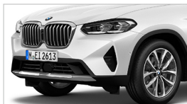
X3 xDrive20i 運動版