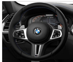
M多功能真皮方向盤搭配專屬縫線 (含換檔撥片) X3 M40i